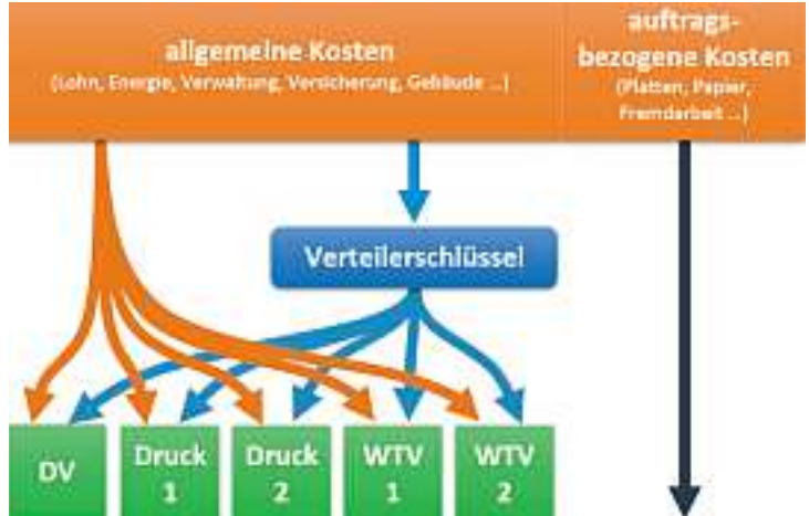
Abb. 2: Die Bestandteile einer korrekten Platzkostenrechnung.

Wichtig sind zwei Zahlen: Die gesamten Kosten, die im Unternehmen in einem Zeitraum angefallen sind, und die Anzahl der Stunden, die die Maschinen in dem gleichen Zeitraum produktiv gearbeitet haben. Die Kosten, die direkt für einen Auftrag angefallen sind (Platten,